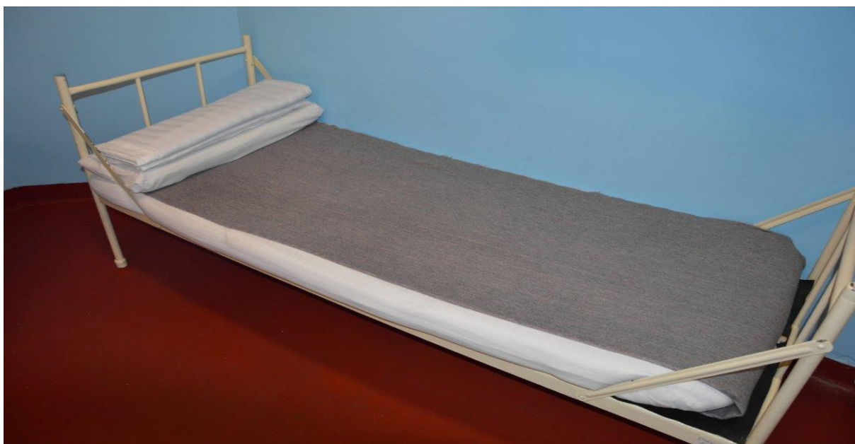
Obrázek č. 1 Vzor ustlaného lůžka